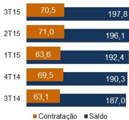
Crédito Comercial (em R$ bilhões)

As operações de saneamento e infraestrutura apresentaram em setembro de 2015, saldo de R$ 68,4 bilhões, crescimento de 33,3% em relação ao mesmo período do ano anterior. Na comparação com o segundo trimestre de 2015, a evolução foi de 8,1%. As contratações para esse segmento atingiram a soma de R$ 5,4 bilhões.