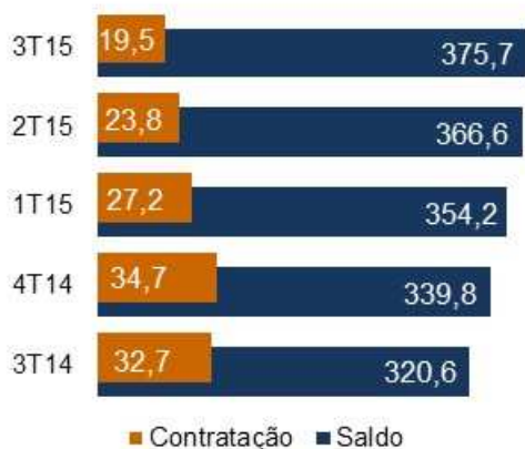
Crédito Habitacional (em R$ bilhões)

Para o Programa Minha Casa Minha Vida, de janeiro a setembro de 2015, foram contratados pela CAIXA R$ 29,3 bilhões, totalizando 263,7 mil unidades habitacionais. Dessas, 5,8% foram destinadas à FAIXA 1 do programa, que atende os beneficiários com renda de até R$ 1,6 mil em modalidades integralmente subsidiadas pelo programa.