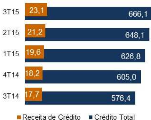
Crédito Total (em R$ bilhões)

As operações com pessoas físicas atingiram o saldo de R$ 103,7 bilhões, alta de 13,1% em 12 meses. Já as contratações avançaram 9,4%, somando R$ 115,9 bilhões no acumulado nove meses de 2015. Entre os produtos do segmento pessoa física, destacam-se o crédito consignado com volume contratado de R$ 23,6 bilhões e saldo de R$ 58,3 bilhões, crescimento de 4,7% em 12 meses e de 13,2% em relação ao segundo trimestre de 2015. A participação de mercado foi de 21,4%, em setembro de 2015.