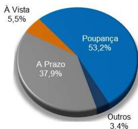
Composição dos Saldos dos Depósitos

Destaque para as letras imobiliárias que evoluíram 40,6% em doze meses, atingindo saldo de R$ 108,0 bilhões em setembro de 2015, o que corresponde a 54,6% de participação no mercado.