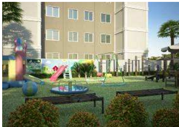
Área de lazer infantil

Para saber mais sobre o Selo Casa Azul CAIXA, consulte o Guia "Boas Práticas para Habitação mais Sustentável", disponível em www.caixa.gov.br/sustentabilidade .