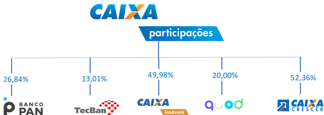
Percentual de Participação da CAIXAPAR no capital total de cada investida. Fonte: DIPAR

A atual participação relativa de cada um dos investimentos contidos na carteira de participações societárias (31/12/20), está representada no gráfico abaixo: